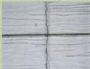
■シーリングの劣化